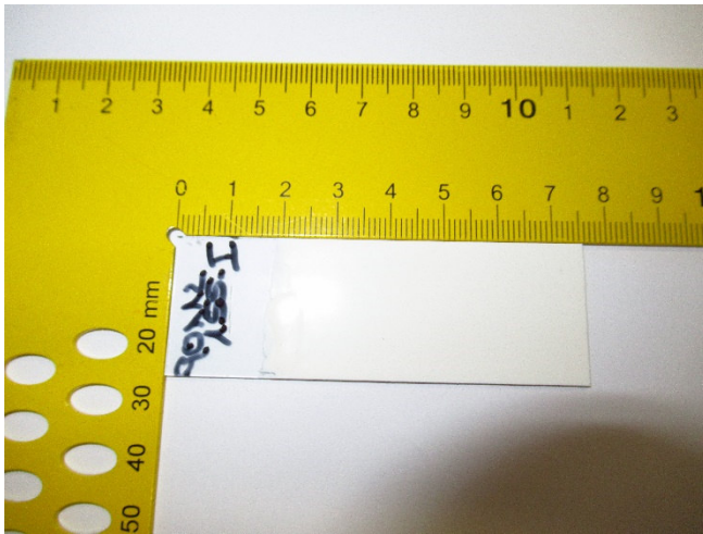
Abbildung 1: Prüfkörper