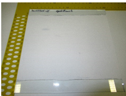
Abbildung 1: Prüfkörper